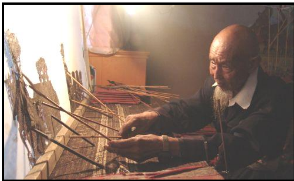
Montreur d'ombres en Chine derrière l'écran

Le théâtre d'ombres consiste à projeter sur un écran des ombres produites par des silhouettes que l'on interpose dans le faisceau lumineux qui éclaire cet écran.