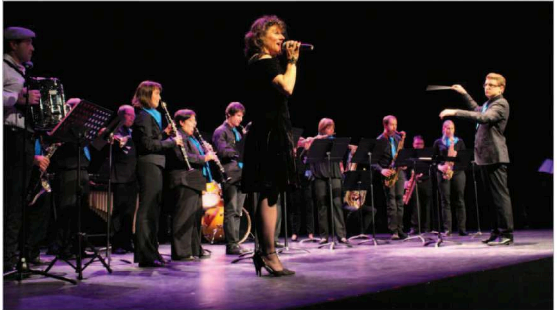
« Non je ne regrette rien », un final de concert interprété tous ensemble.

Elle a invité à 2 reprises des messieurs à la rejoindre sur scène pour le temps d'un instant entrer dans la peau de Marcel Cerdan. L'artiste a invité ceux qui avaient l'air de bien connaître Pigalle à 7 pater nos-ter ce week-end lors de la messe officielle par le père Baldaci-