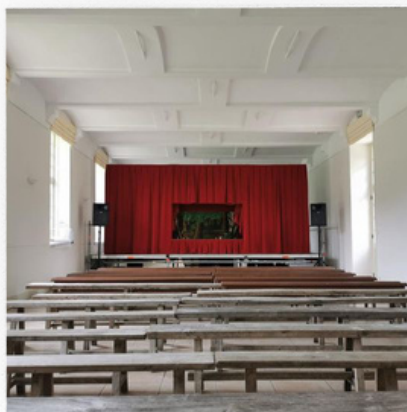
Château de Tilloloy Salle sans gradins