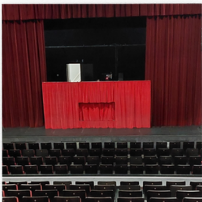
Entrepôt des Sels Saint-Valery-sur-Somme Salle avec Gradins