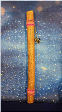
Bâton de pluie