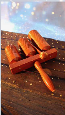
Tube de resonance