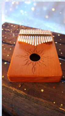
Piano à pouce