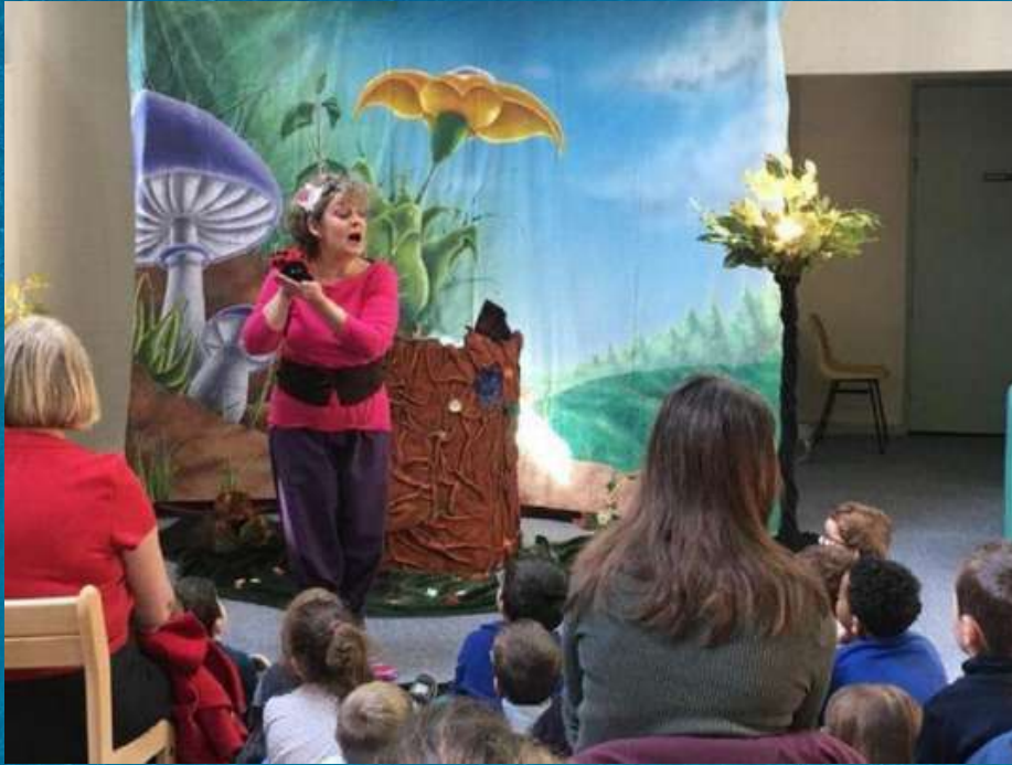
Sofi, alias framboise, avec mademoiselle coccinelle

La compagnie Allo Maman Bobo est revenue à Ormes, mercredi matin. Cette fois-ci, le spectacle a eu lieu à la bibliothèque. Il s'adressait aux tout-petits.