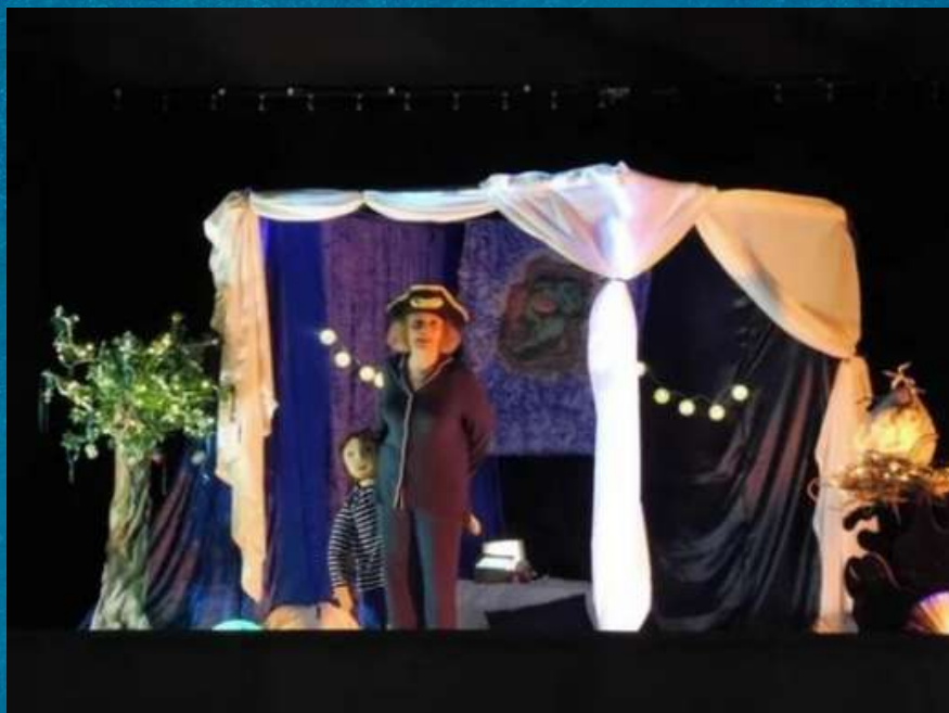
La compagnie Allo Maman Bobo a présenté le conte

Le mercredi 17 mars au matin, la première animation culturelle de l'année a eu lieu dans la salle des fêtes de Bellegarde. Les cinq classes de l'école maternelle ont été conviées à une animation conte d'une durée de 40 minutes.