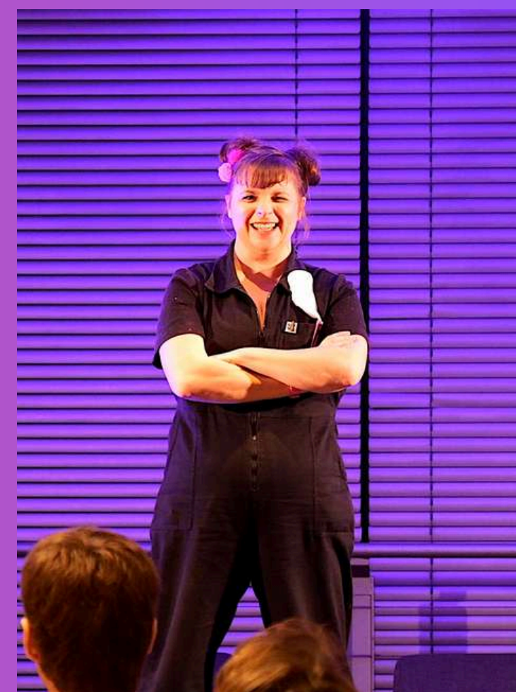
scène ouverte - Feminist Futures Festival

Le divertissement et ses formes populaires théâtrales ont toujours passionné notre équipe artistique. Toutes les formes de rire portent invariablement un regard, la forme du seule en scène d'humourE vient compléter notre exploration de la comédie.