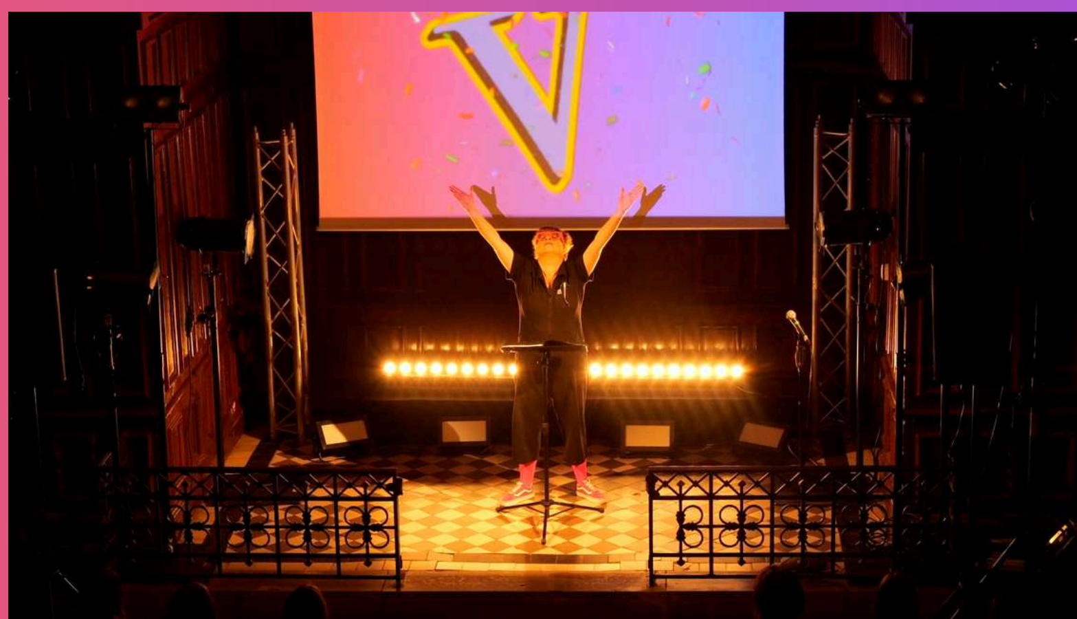
lecture-spectacle Lycée Félix Faure - Beauvais

Pensé pour une scène frontale, mais adaptable à des configurations plus immersives, « VerVe, avec un grand V » s'adresse à tous ceux qui croient encore que le rire peut secouer, bousculer, éveiller. Un spectacle comme un clameur. Comme un cri de joie. Comme une nécessité.