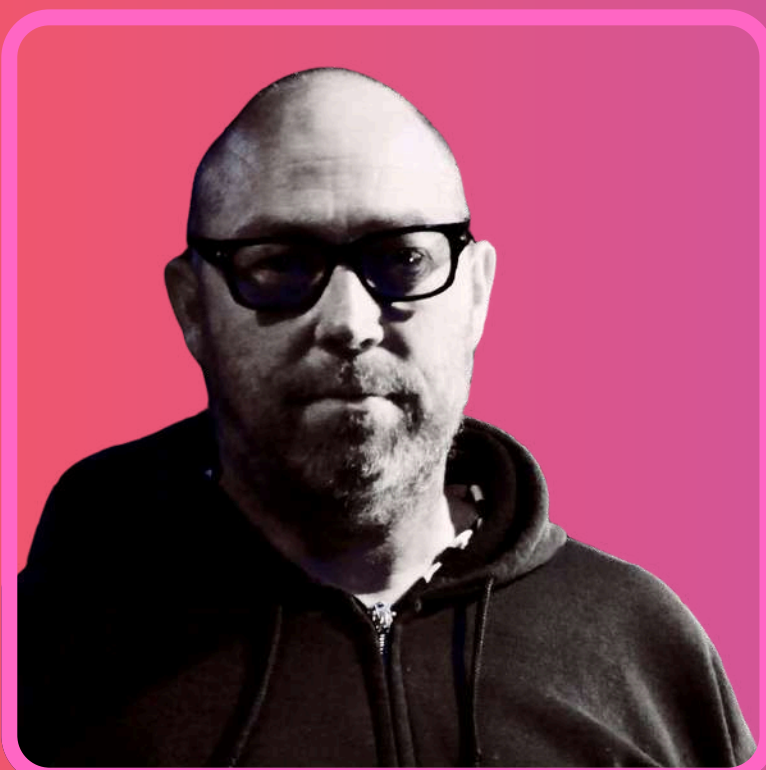
Benoit André Création Lumière et régie générale