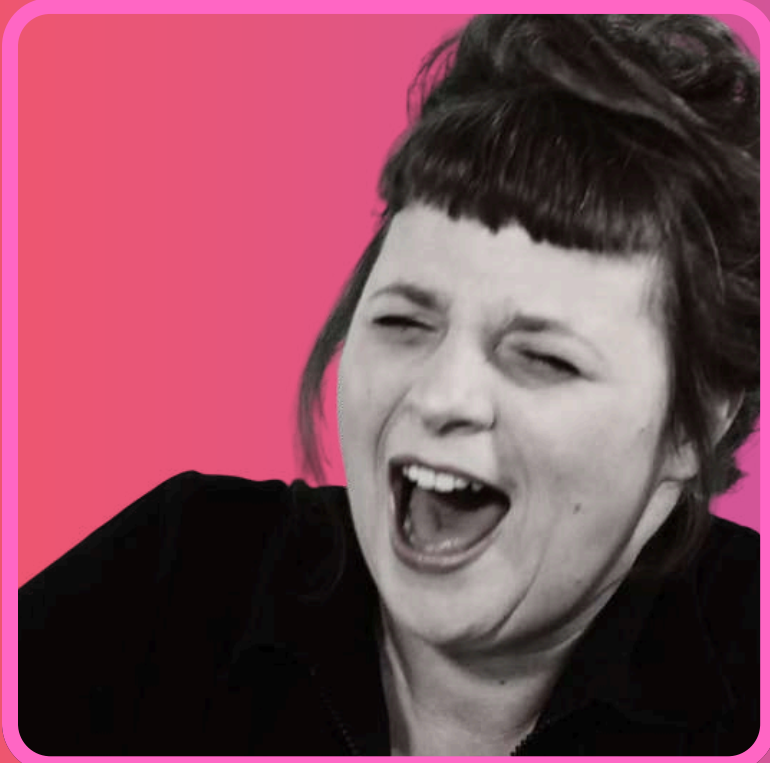
Mylène Gueriot Texte et mise en scène interprétation