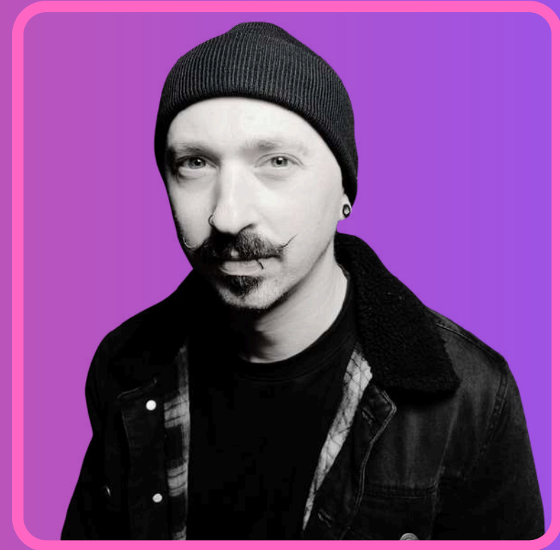
Arnaud Beaudry création vidéo régie