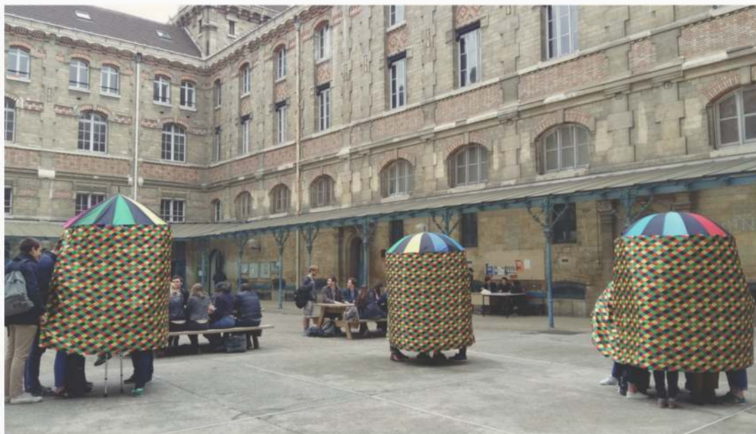
Les Patrouilles de Parapluies - D'un écran à l'autre.