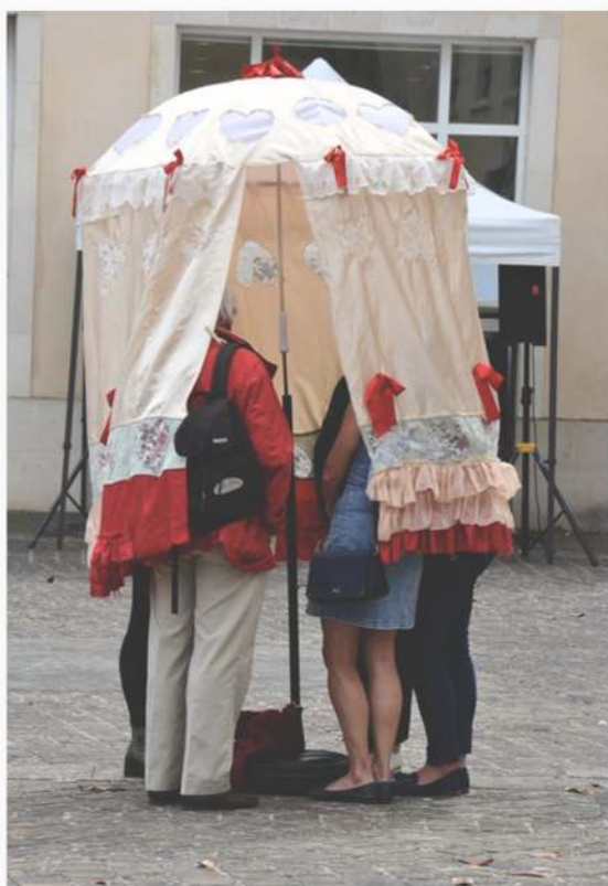
Les Patrouilles de Parapluies - Amoureux.