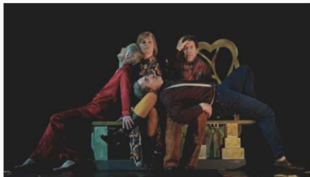
La brève liaison de maman, 2023.