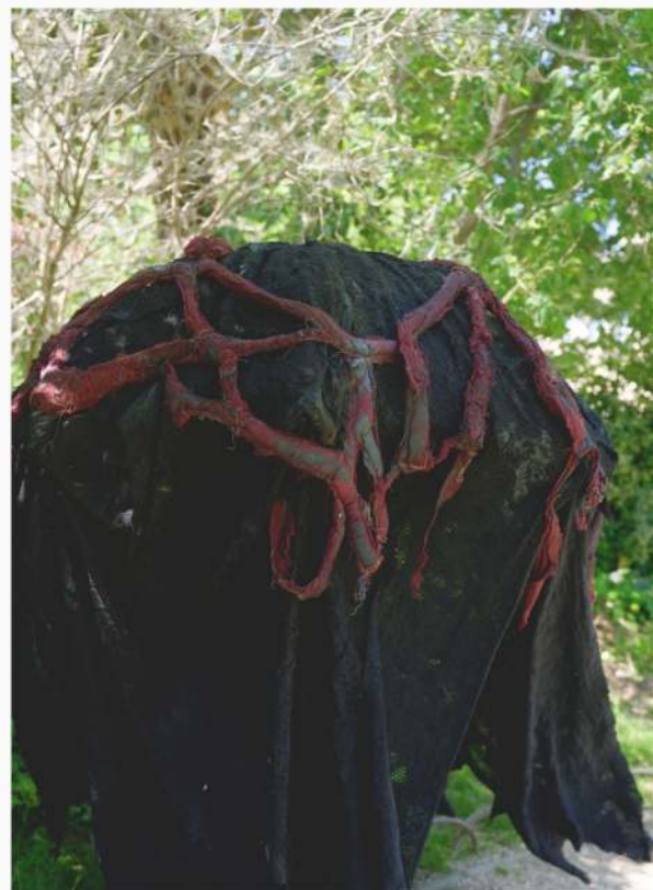
Les Patrouilles de Parapluies - Hantée.