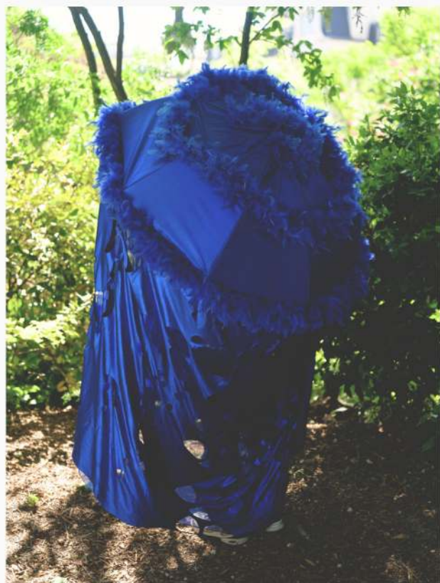
Les Patrouilles de Parapluies - Têtons et côlons.