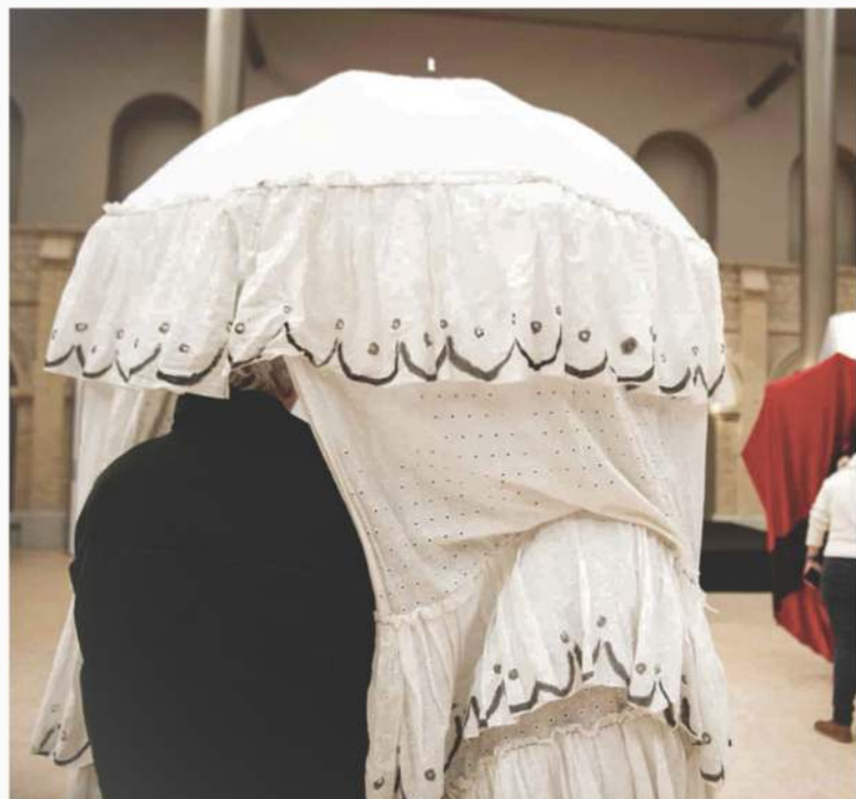
Les Patrouilles de Parapluies - Poétiques.