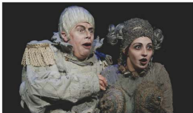
Ubu Président, 2025.