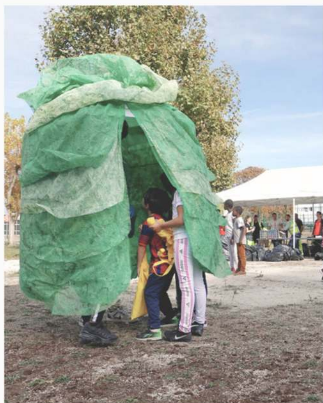
Les Patrouilles de Parapluies Verts - Raconte-moi des salades.