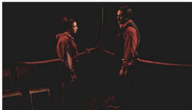
Boxing Shadows, 2020.