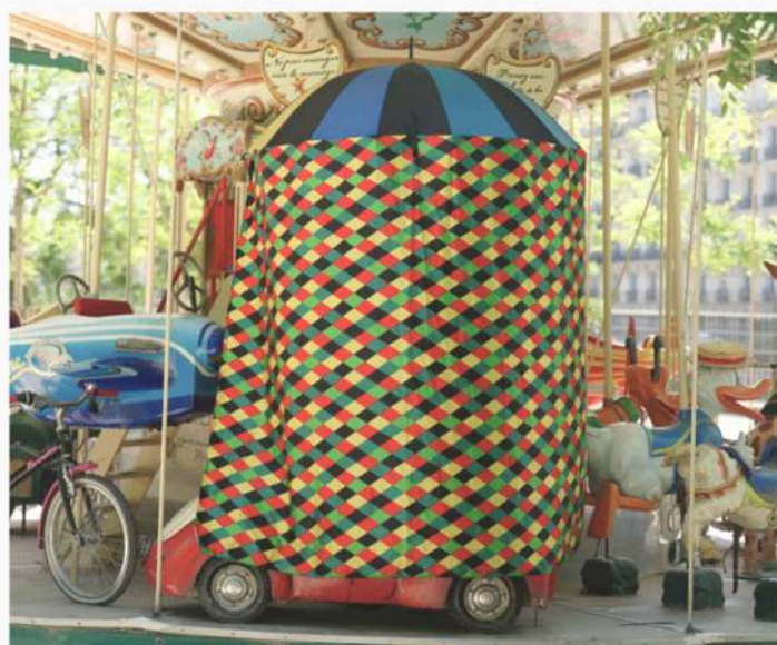
Les Patrouilles de Parapluies - Liberté, Egalité, Fraternité.