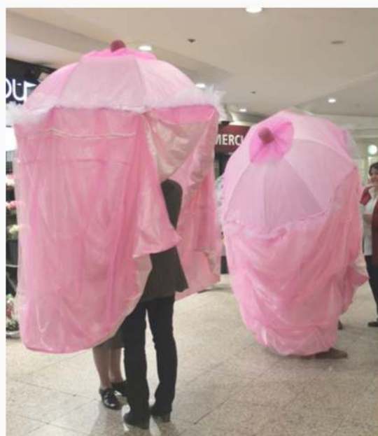
Les Patrouilles de Parapluies - Têtons et côlons.