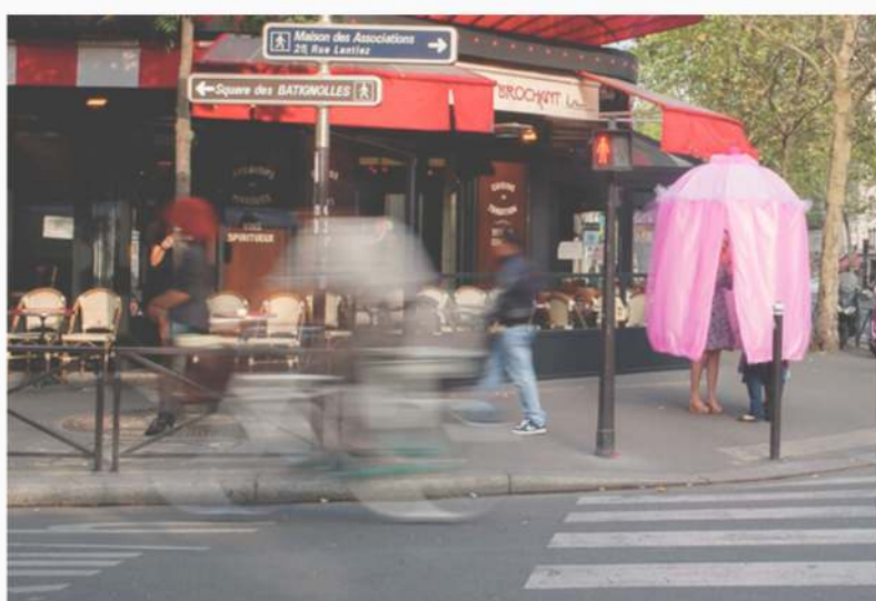
Les Patrouilles de Parapluies - Sous les jupes des Femmes.