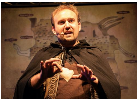
Avec son maître du jeu

Participez avec nous à l'aventure de l'Ordre des Masques d'OR !