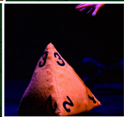
Et Lancez le dé géant

Réussite critique est un spectacle participatif improvisé où l'histoire se construit en temps réel, interprétée par trois aventuriers et un maître du jeu. À la manière d'un jeu de rôle, nos aventuriers évoluent dans un univers singulier dont la géographie, le bestiaire et la mythologie, favorisent l'immersion du public.