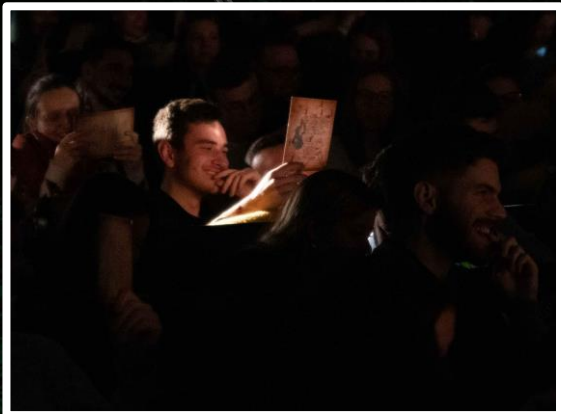
Un spectacle interactif