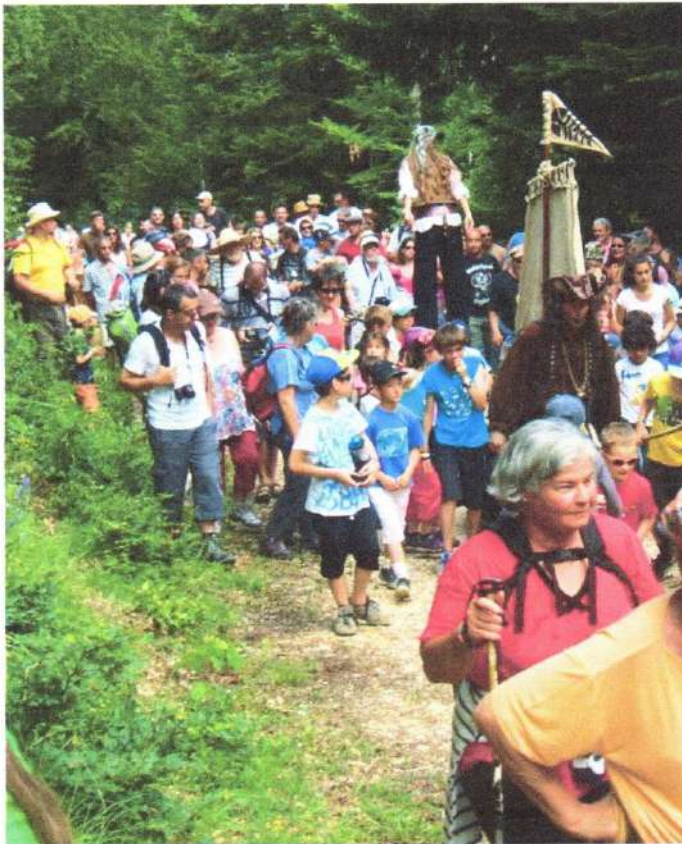
Le 8 e Festicol a connu un véritable succès populaire avec plus de 200 visiteurs. Un succès populaire avec plus de 200 personnes