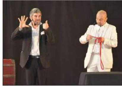
Les deux magiciens de la compagnie "Les bandits manchots" ont donné le ton de Noël en offrant des tours de magie intrigants aux enfants conquis.

C'est au gymnase de la Ventive que plusieurs centaines de parents et enfants se sont retrouvés vendredi pour assister à un