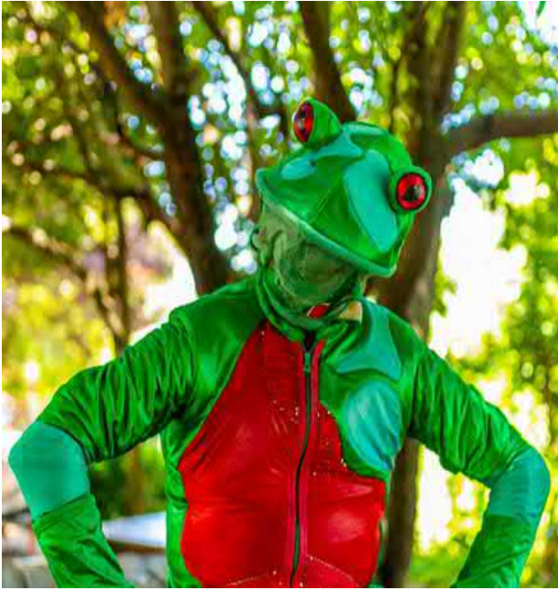
Ernest, le batracien géant du professeur Houston

Duo déambulatoire sur échasses bondissantes et grand-bi