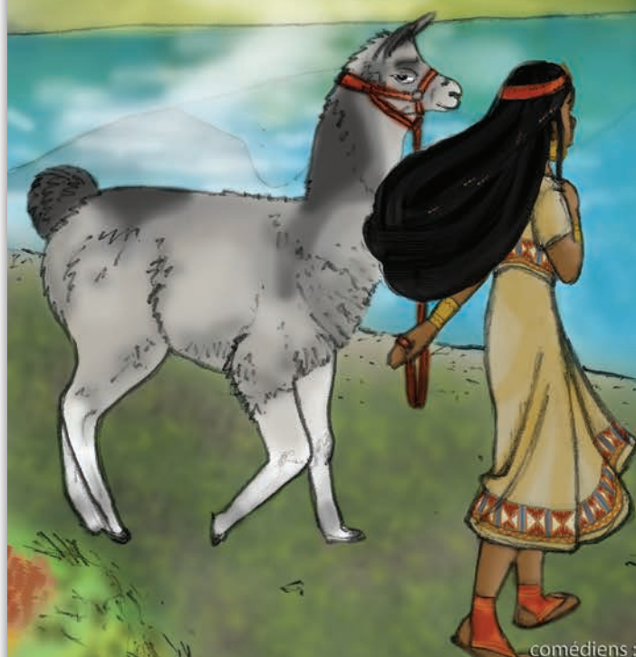
Illustration | Amélie RICCA

un spectacle de Jean-Felix Milan une création Tsemerys