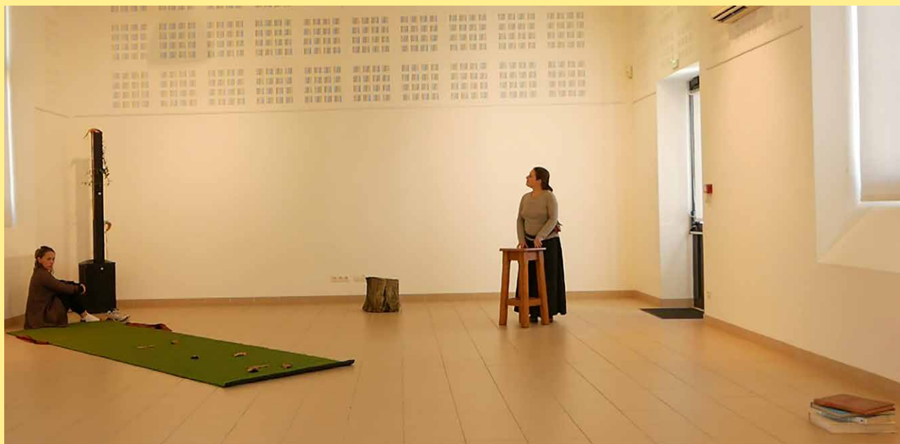
Disposition en salle - résidence de création - Barbâtre - octobre 2021