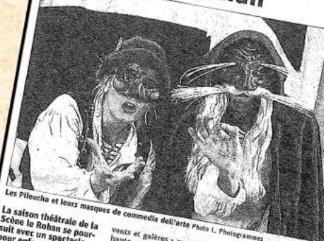
Les Piloucha et leurs masques de commedia dell'arte

La saison théâtrale de la Scène Le Rohan se poursuit avec un spectacle pour enfants, le 17 décembre prochain. À la louche qui débarras la création « Frimousse contre vents et galères ».