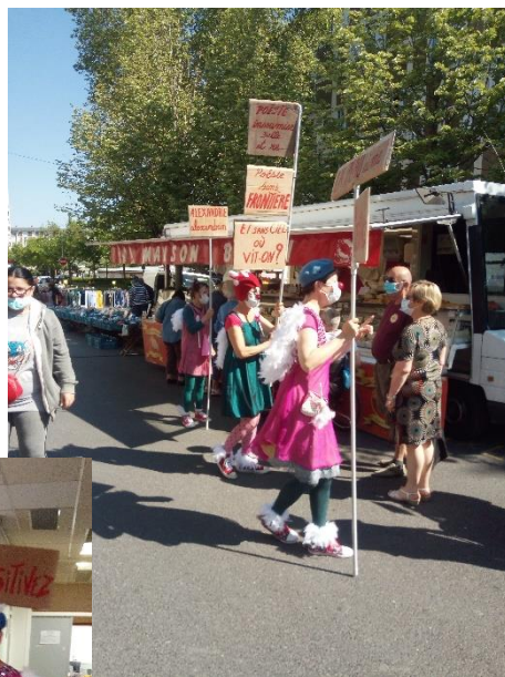
Reims, marché Châtillon, juin 2021

« Leur spectacle en déambulation était ludique, joyeux, interactif et de qualité. Très beau moment, les habitants, les commerçants et les enfants ont vraiment apprécié. »