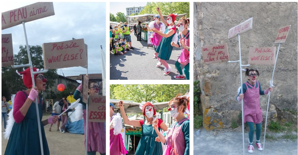
Reims, marché Châtillon, juin 2021 Galop de Clowns, Souternon, août 2021

À savoir : soit l'organisateur prend en charge l'hébergement des personnes / soit défraiement au tarif syndac