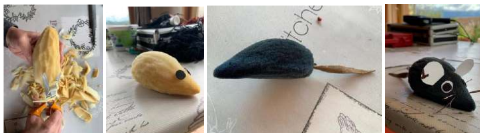
Naissance d'une souris