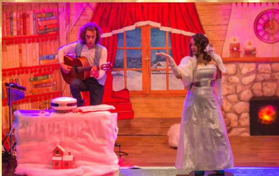
Spectacle « Zéphirine et les légendes de Noël »

La compagnie s'attache à créer un lieu de partage et d'ouverture au théâtre pour tous, dans un réel désir d'échange avec le jeune public.