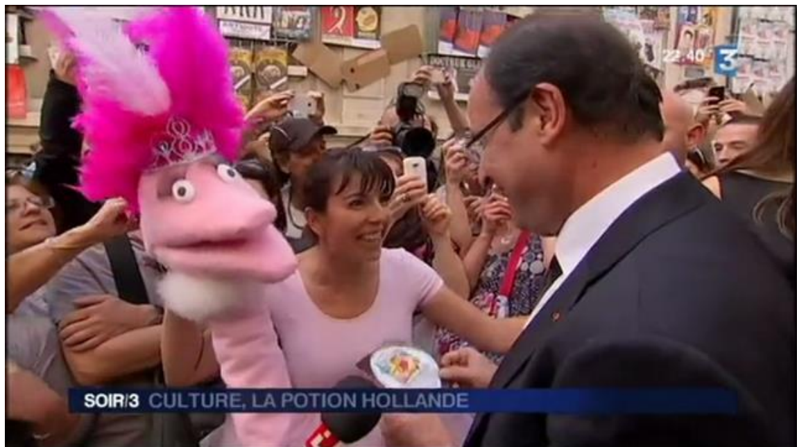
France 3 Edition nationale (15 juillet 2012)