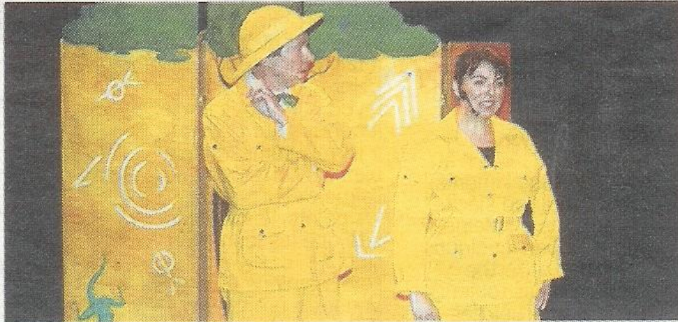
■ Les facéties de Philibert, explorateur, et de Malice, sa complice.