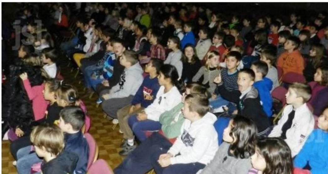
Plus de 500 jeunes ont assisté à ce spectacle épatant.

le 24/12/2013 à 05:00 | M. P. (CLP) Vu 70 fois