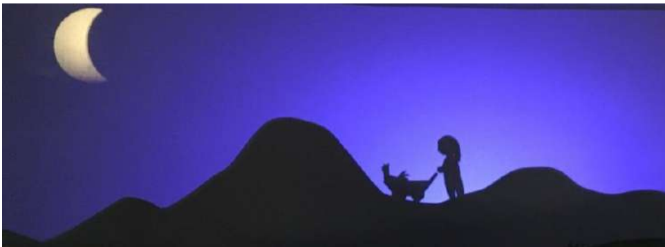
Sur la toile de fond qui représente les montagnes.

Plusieurs emplacements pour développer le théâtre d'ombre