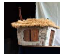
Les étapes de fabrication de la maison