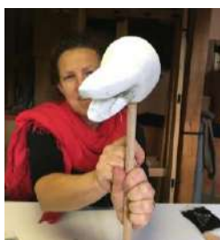
Les étapes de fabrication de la marionnette Loup