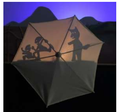
Derrière un parapluie