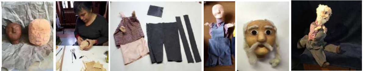
Les étapes de fabrication de la marionnette Barnabé

Marionnettes, décors, accessoires... tout est « Made in Théâtre Talabar »