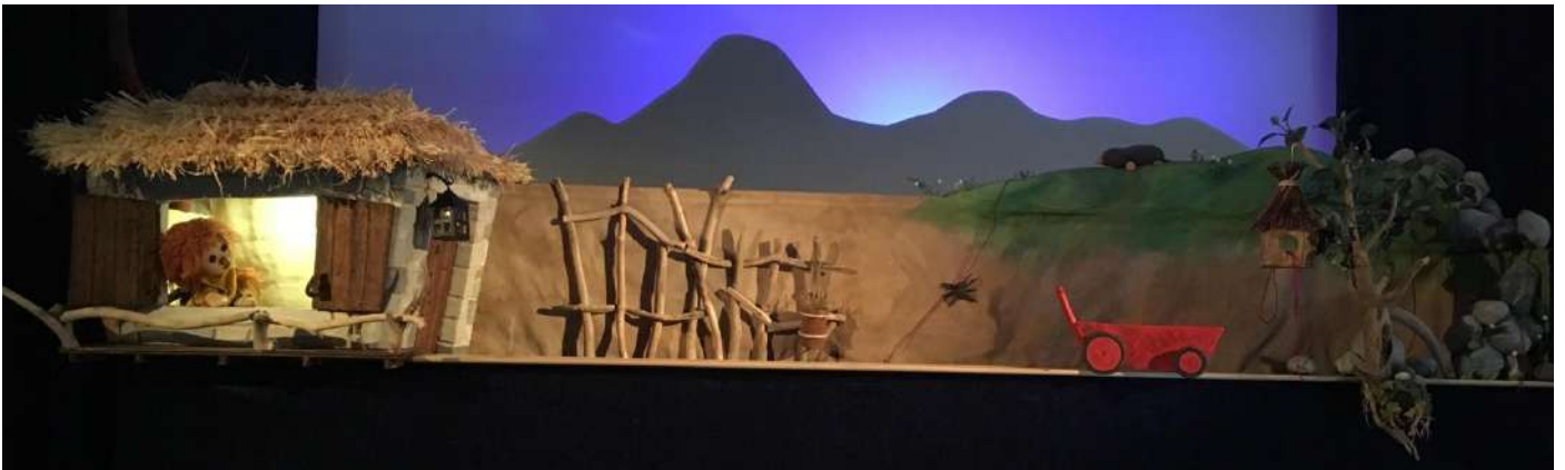
Deux niveaux de jeu : la vallée où vit Barnabé (1 er plan), et la colline (2 ème plan)

Plusieurs espaces scéniques ont été imaginés avec des plans de différentes hauteurs et profondeurs qui permettent le cheminement des marionnettes.