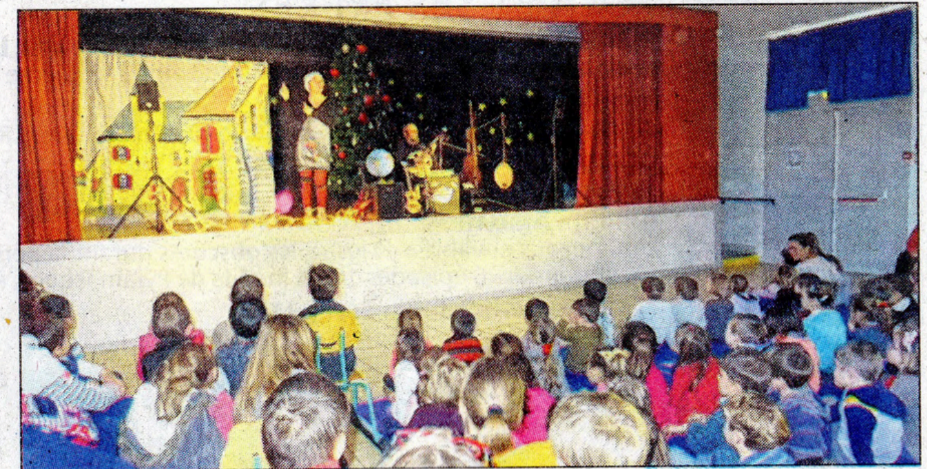
Plus de 200 enfants ont profité du spectacle.

À travers les contes de Capucine, ils ont eu un aperçu des traditions de Noël telles qu'elles se prati-