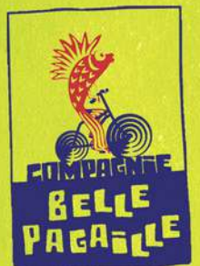
illustration : Perrine Boyer