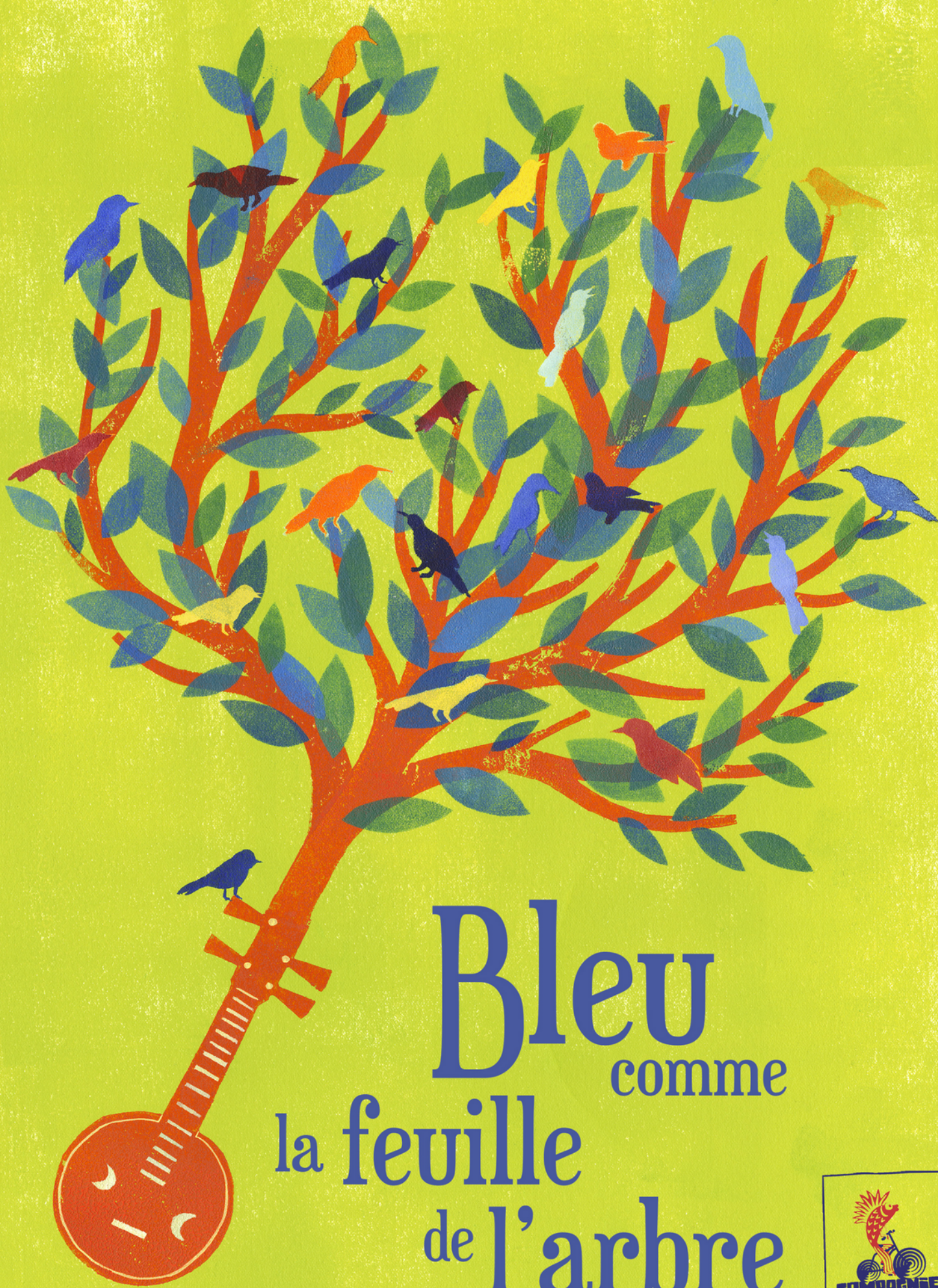
illustration : Perrine Boyer