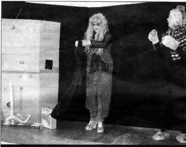
Le message passe très bien avec un zeste de drôlerie

La compagnie théâtrale l'Escapade, a tout bon puisqu'elle a su non seulement passionner son jeune public mais également les parents présents qui ont éprouvé, durant 55 minutes, au moins autant de plaisir que leurs bambins et retrouvé l'espace d'un instant leur âme d'enfant.