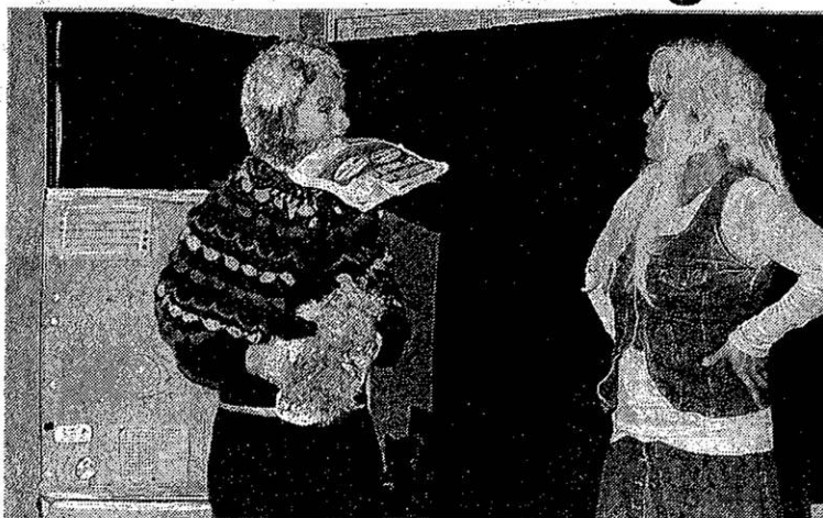
Tri et recyclage étaient expliqués par les jeux de scène des deux artistes.

Depuis 2004, les deux jeunes femmes proposent des spectacles autour de l'environnement et de l'écologie, pour un public jeune jusqu'en CM2, mais dans les faits, c'est tout un public qui participe de manière interactive à ce moment pédagogique qu'elles appellent : « un spectacle de 3 à 333 ans ». Les parents présents avec les enfants rigolaient autant que les jeunes, tout en participant avec eux, aux ani-