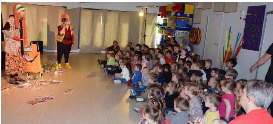
Les élèves de l'école maternelle de Vassy-Valdallière passionnés par les aventures écologiques. - Jacques Boisseau