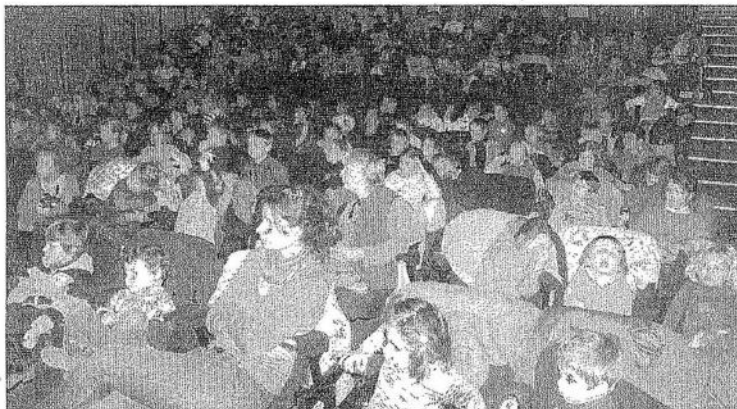
Après avoir été présenté la veille à l'auditorium du Village 92, la pièce "Tigrella, la sorcière de la déchetterie", produite par la Compagnie Escapade, a vécu une seconde représentation, mardi, salle Calloc'h.

Vosges Matin, 15 Octobre 2011 – Didier JACQUELIN