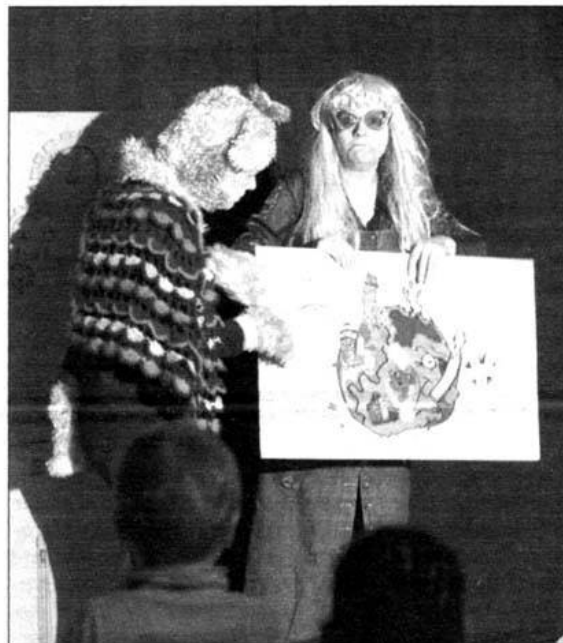
Un spectacle inventif et amusant.

N otre maison brûle, et plutôt que de regarder ailleurs, la MJC Les Terrasses avait décidé, vendredi 5 janvier, d'initier les petits à l'écologie.