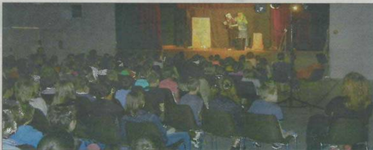
► Les enfants assistent au spectacle sur le recyclage et le tri.

En guise de spectacle de fin d'année, une vingtaine de classes a assisté à une représentation sur le thème du recyclage et du tri.