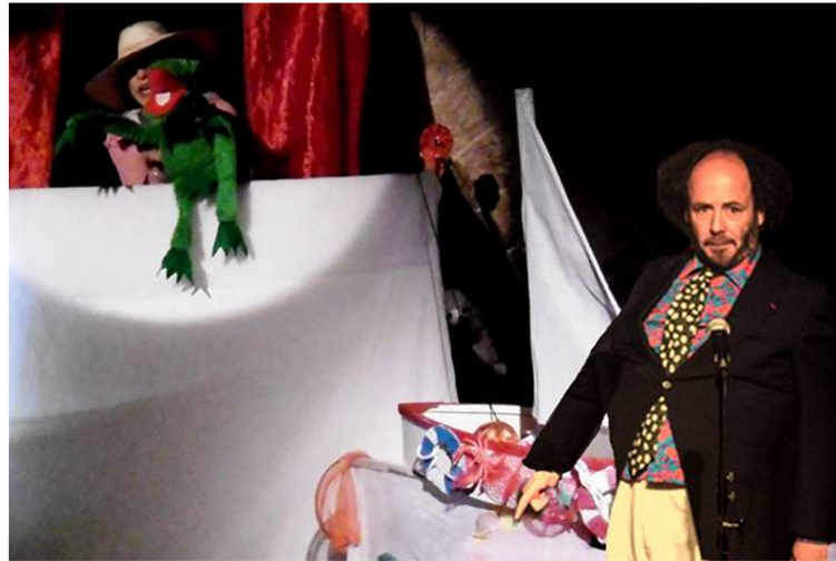
La grande Lili fait son show avec tous ses amis !

C'est l'heure du Show présenté par le célèbre Albus Grimale qui accueille en exclusivité la grande star Lili Flamingo, une star immense ! Eh oui c'est un flamant rose, un oiseau sur échasses, quelle classe ! Eh bien non, car même si être grand a plein d'avantages, notre grande Lili subit les moqueries incessantes de Billy le poisson. Lili finit par avoir honte de sa taille et elle n'est pas prête à se montrer. Heureusement Albus Grimale a plus d'un tour dans son sac et un tas d'amis petits mais géniaux. La cane blanche aveugle et le gros bourdon pataud vont montrer l'exemple. Quand on ose la vie est plus rose.