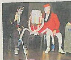
■ Les compères déguisés en pilote et hôtesses de l'air en compagnie de leur otage.

en parachute, traversée du désert, rencontre avec un génie. Les bruitages puissants complètent un décor de scène travaillé. Mais le périple vaut le déplacement et les situations les plus invraisemblables se succèdent en musique et en plusieurs langues. Au final, une excellente soirée de détente. ■