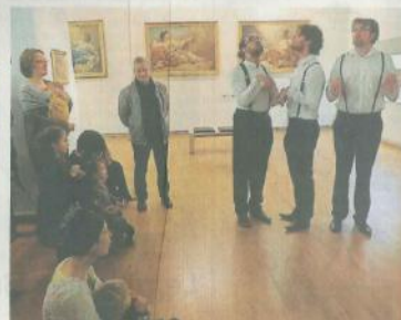
Cholet, Musée d'art et d'histoire, hier. « Doum... Ah ! » Des sons clairs et des mélodies enjoués devant les tableaux.