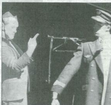
Royal Air Force, par la compagnie le Brant de l'escadron pour un théâtre à découvrir en famille. Et "Ubu Roi" par la compagnie Anikina théâtre. (1)