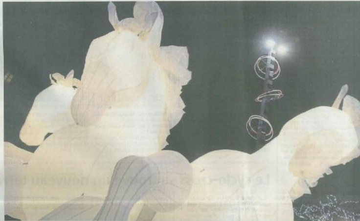
Cholet, place Travoit, hier soir. Un moment de douceur et de poésie offert par la compagnie Fiers à cheval. Et la foule était au rendez-vous.

Les Choletais ont été pris par surprise hier après midi dans le centre-ville de Cholet. Vers 15 heures, un drôle d'engin volant trop près du sol, saluait les curieux. Les « C'est quoi ce truc ? », « C'est super marrant ! » virent bon train, pendant que Jérôme, ou plutôt le pilote de « l'aréopostale », criait dans son mégaphone : « Un vrai looping horizontal ! Mesdames, messieurs ! » tout en faisant « pouet-pouet » avec son vieux Klaxon. Vers 16 heures, rebelle, aux croisements des rues de l'Orangerie et Nationale. Cette fois, elles ont été bloquées pour laisser place à la générale d'homologation chargée de valider le recours de ski sur goudron ! Une nouvelle pratique à mi-chemin entre le ski nautique et le ski de glisse. Une belle tranche de rire pour les petits et les grands. Au musée, ambiance plus feutrée et studieuse. Quelques arrêts devant des tableaux et sculptures choisies par les Garçons S'il vous plaît chantant des airs connus ou des poèmes. Tout en douceur. Enfin le clou du spectacle, la déambulation féerique de la compagnie Fiers à cheval. Des chevaux en toile, animés grâce à un soufflet d'air. Un moment de grâce, de poésie, qui a fait briller les yeux d'enfants ébahis.