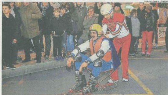
Cholet, place du Puits-de-l'Aire, hier. Record de 30 mètres battu en ski américain sur bitume.