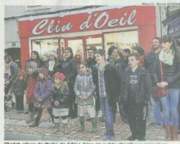
Cholet, place du Puits-de-l'Aire, hier. Un public attentif aux animations proposées par le collectif Jamais trop d'art.