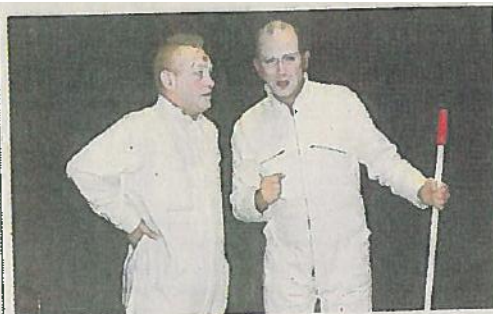
■ Toc-Toc et Rigoberto rêvent de voyage.

La compagnie « Le brame de l'escargot » donnait son spectacle, samedi. Le titre de la troupe suffisait à donner le ton de ce spectacle mis en scène par Jérôme Ogier et Nathalie Chemelny : absurde et poétique, pathétique et tendre, il n'a laissé personne indifférent. Devant une salle comble, Toc-Toc et Rigoberto se sont livrés à une fantaisie délirante. Techniciens de surface dans un aéroport, ils rêvent de s'envoler comme tous les passagers qu'ils voient défiler. À la fois clowns et comédiens, leurs gags déclenchent les rires des spectateurs. Les deux compères finissent par s'emparer d'un avion et décolleront pour un voyage mouvementé. Prise d'otage, traversée de turbulences, saut