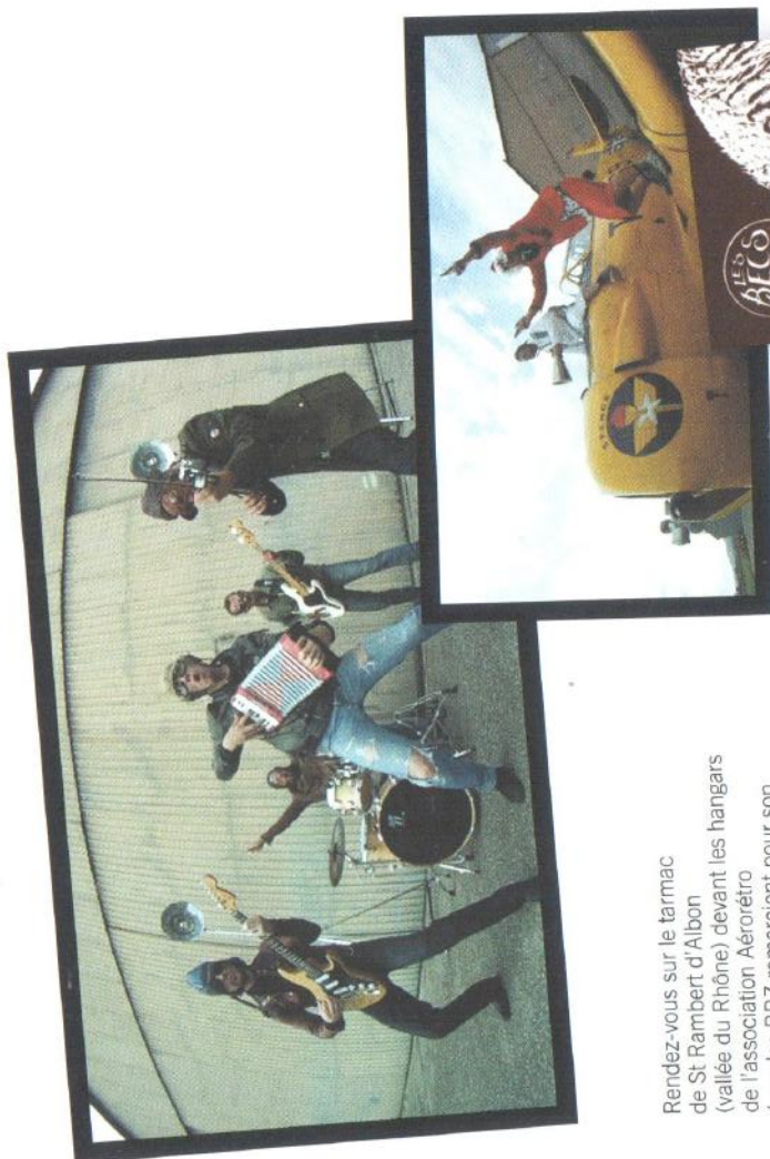
Rendez-vous sur le tarmac de St Rambert d'Albon (vallée du Rhône) devant les hangars de l'association Aérorétro (que les BBZ remercient pour son formidable accueil) qui sortira gentiment quelques-uns de ses magnifiques appareils : Yak 11, T 6, Zéro, etc.

Les yeux larmoyant (adieu mon vieux casque, adieu mon masque !) à cause du vent relatif... J'ouvre. Sur les 5 sauts, une seule ouverture un peu sale : lors du 4 ème saut, Twist again ... J'ai la main gauche un rien tétanisée d'avoir tenu le violon hyper-ferriment pour qu'il ne s'envole pas, je me dé-twiste comme je peux, prêt à lâcher le violon et faire une libé si ça dégénère... La voile reste docile et moi calme : ouf ! J'ai beau être musicien, je n'apprécie pas particulièrement le twist, surtout un violon à la main !