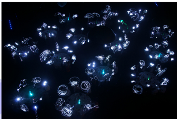
Les 160 employés de la société Roldeco, pour les 20 ans de la société.